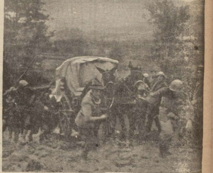
Yunan ordusunun kahramanca hareketi karşısında müşkülâc içinde bocalayan bir İtalyan kolu

Mihverle ve tahsisen Almanya ile İngiltere arasında yaman bir uçak harbi aylardan beri sürüp duruyor. Bu dehşetli ve vahşi harbin yakın bir günde kesileceğine ve kesilebileceğine delâlet edecek en ufak bir alâmet yoktur. Onun için, her iki taraf memleketlerinin o güzelim şehir ve limanları, yüksek tarih ve san'at eserleri, fabrikaları, tersane ve tezgâhları, elhasıl medeniyetin asırlardan beri yaptığı ve yığıdığı bütün iyi, güzel ve faydalı şeyleri, böylece harap olup gidecektir. Bu meydana ölecek veya sakat olacak binler ve on binlerle, kadınlı ve erkekli çocuk ve ihtiyarlar da caba. (Devamı 7 nci sayfada)