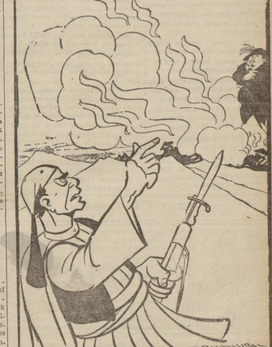
Gazetelerden: Görice yayıncı GÖR... İYİCE..

Sofya 20 (A.A.) — Stefani: Bulgar Harbiye Nezaretinin bir teb - lüğünde bildirildiğine göre, Patta kö - yü civarında yolunu şaşırarak Bul - gar arazisine girmiş olan iki Türk as - kerî, iki millet arasındaki iyi kom - şuluk münasebetleri dolayısıyla ser - best bırakılarak Türk hudud maka - matına iade edilmiştir.