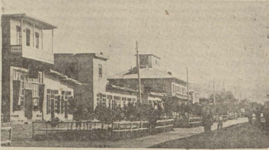
Vanda çarşı meydanı

Cumhuriyete bir harabezar halinde intikal eden bu şehrimiz 17 yılda çok süratli bir şekilde inkişaf etti