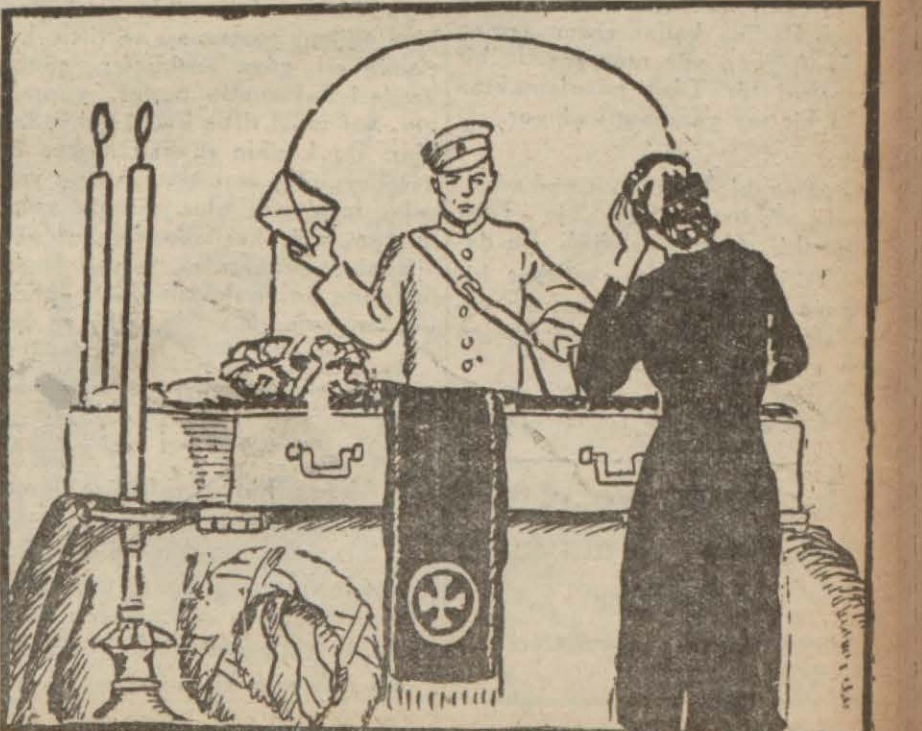
Evvelki gün morgda bir cesedi, yanlış teşhisi yüzünden çok garib bir hâdise cereyan etmiştir.

Edirnekapıda bir Ermeni ailesinin başından çok garib bir hâdise geçti